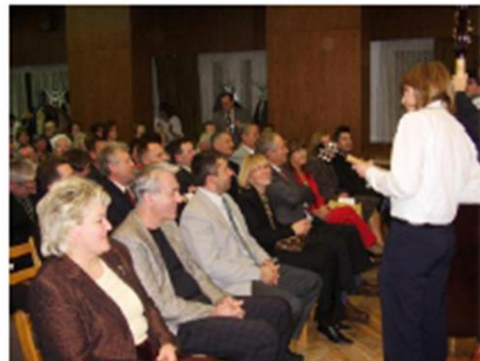
„Horvát est” zenével Hrvatska večer-hrvatska glazba