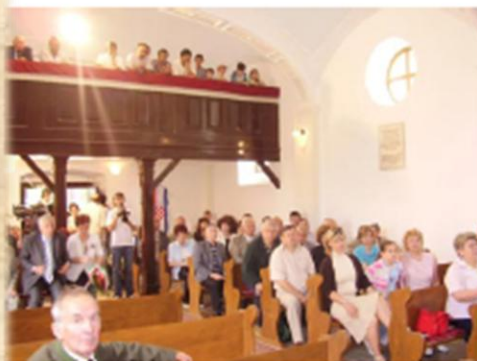
Istentiszteleten Eddén Svečana misa u Eddi