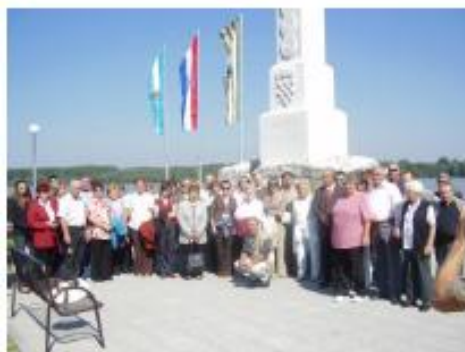
Látogatás Vukovar-on / Posjet Vukovaru