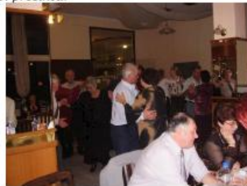
Horvát bál Hrvatski bal