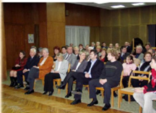
„Horvát est” „Hrvatska večer”