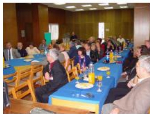
Közgyűlés 2004. szeptember 28-án / Skupština