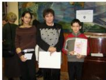
Vers- és prózamondók Recitatori