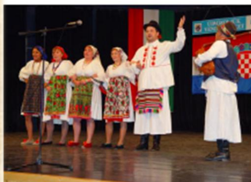
VUNENAŠ énekegyüttes Tótújfaluból KUD iz Novog Sela