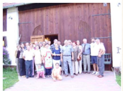
Jagnjedovaci fényképek S našim prijateljima u Jagnjedovcu