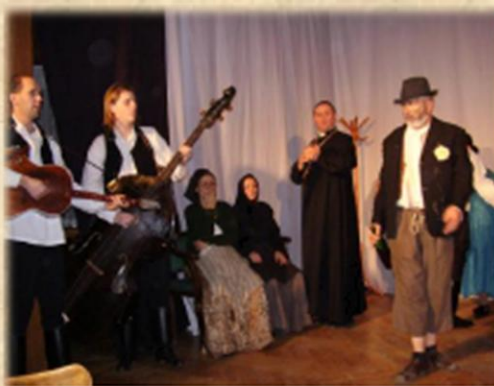
Színházi előadás / Kazališna predstava