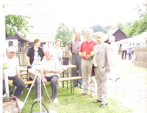
Főzés Veliko Trojstvo-ban Okusi i mirisi na slici iz V. Trojstva