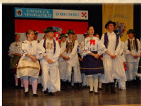
HORVÁT EST mohácsi táncgyüttessel Hrvatsko veče uz mohačko KUD