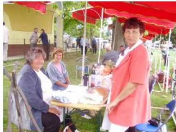
Káposztás ételek / Jela od kupusa