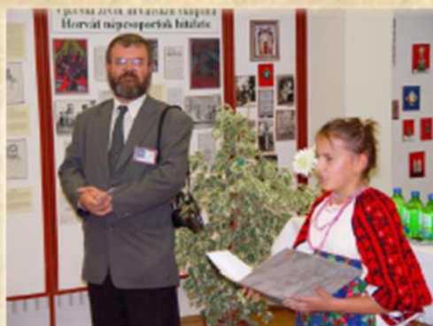
Néprajzi kiállítás Izložba povjesnog materijala