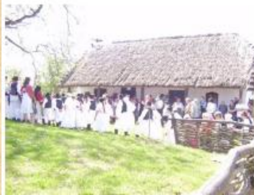
Lakócsa / Lukovišće