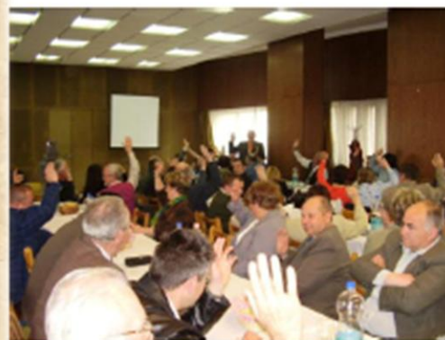
Közgyűlés Sudionici skupštine