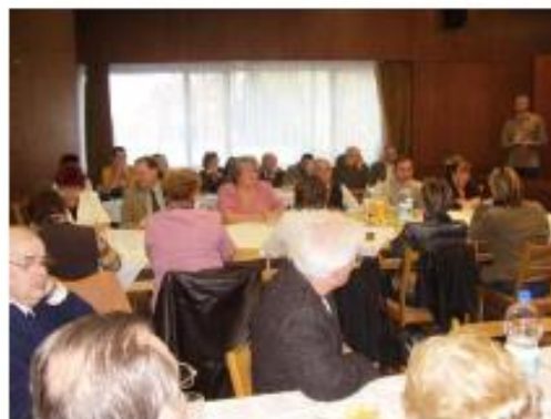
Községülés résztvevői / Sudionici godišnje skupštine