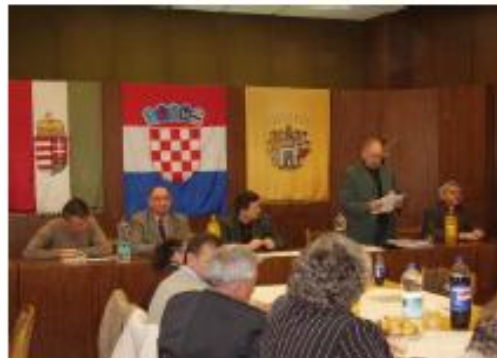
Községülés Godišnja skupština