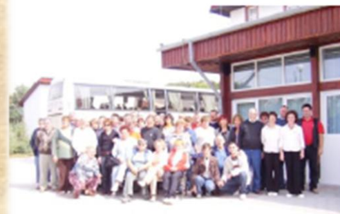
Pagon Na Pagu