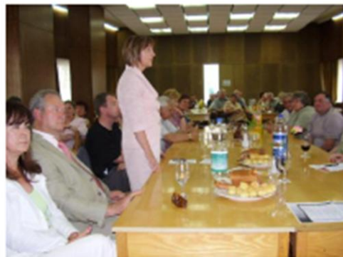
Községi ülésen Skupštinska sjednica u sjedištu udruge