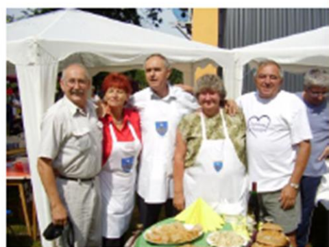
Töltött káposzta az igazi Fina hrvatska jela od kupusa