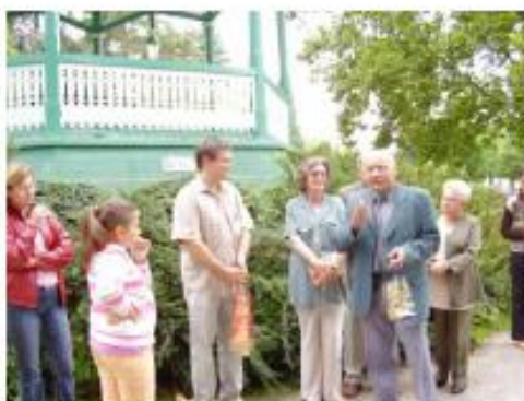
Kapronca város polgármestere Gradonačelnik Koprivnice