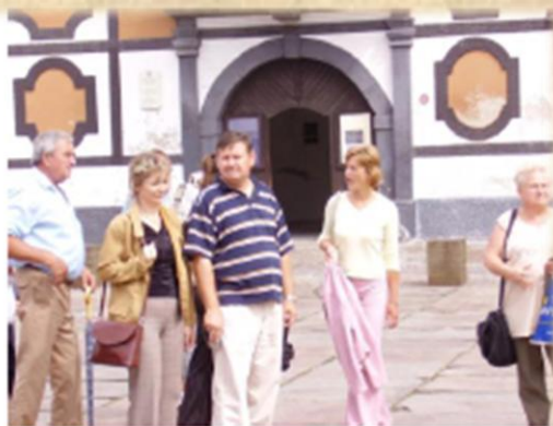
Kirándulás Varasdón Slike iz Varaždina