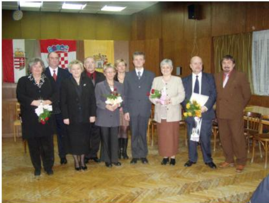
Elismerésben részesültek Istaknuti članovi