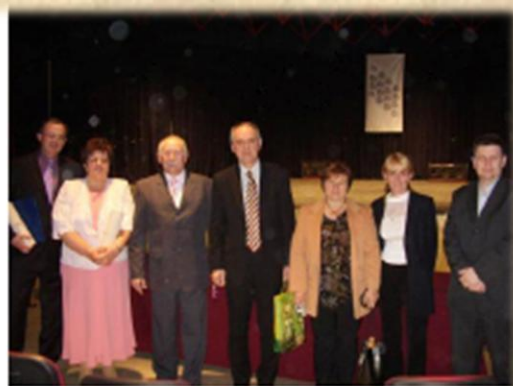
Nemzetiségek a „Tavaszi Fesztiválon” Nacionalne manjine na proljetnom festivalu