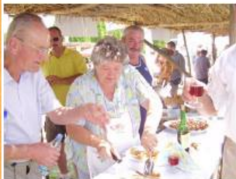
Főzőverseny Ecsényben Kulinarsko natjecanje u Ecsény-u