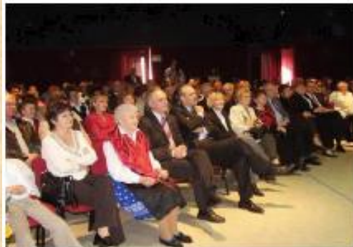
Tavaszi Fesztivál Proletni festival