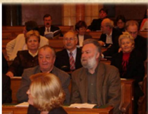
Választás a Parlamentben Izbor u Parlamentu