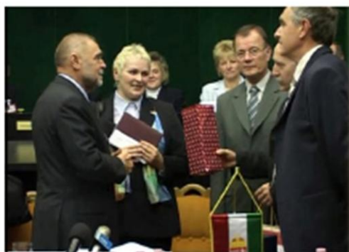
Fogadáson Na prijamu