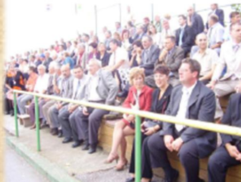
Gudovaci kiállításon és vásáron Mađari u Gudovcu