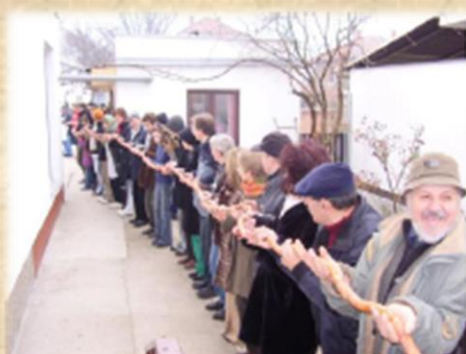
Kolbász folyam Pélmonostoron Divovska kobasica iz Belog Manastira