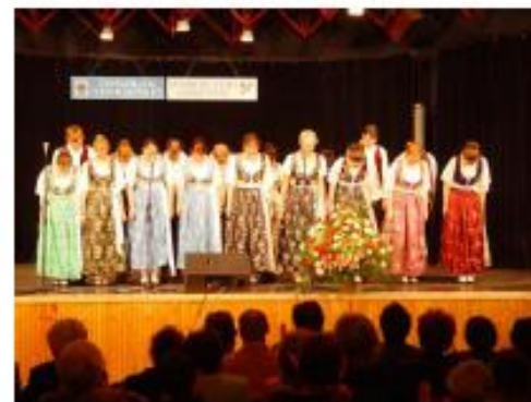
BARANYA kulturális egyesület KUD „Baranja”