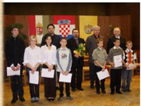
Vers- és prózamondók Recitatori