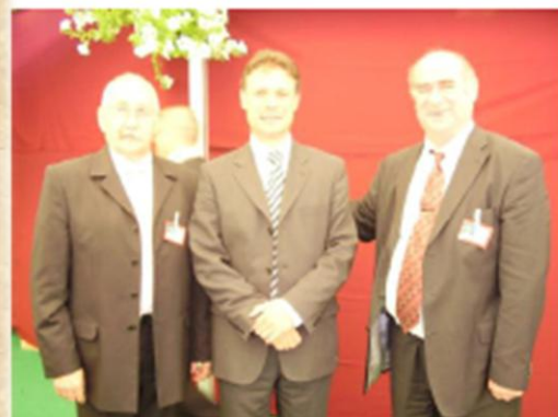
A HK Külügyminiszterével Bjelováron U Bjelovaru s Ministrom vanjskih poslova