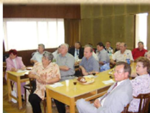
Sokan a tagságból Ima nas u lijepom broju- članovi udruge na sjednici