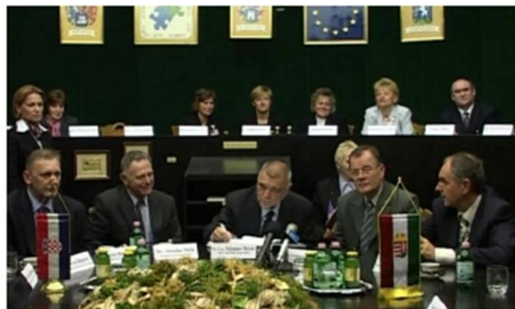
Ünnepi közgyűlés Stjepan Mesić HK Elnök látogatásakor Svečana sjednica s Predsjednikom Mesićem