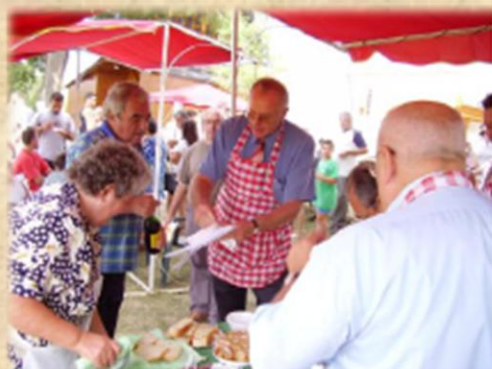
Kóstoló Ni je lako biti član žirija...