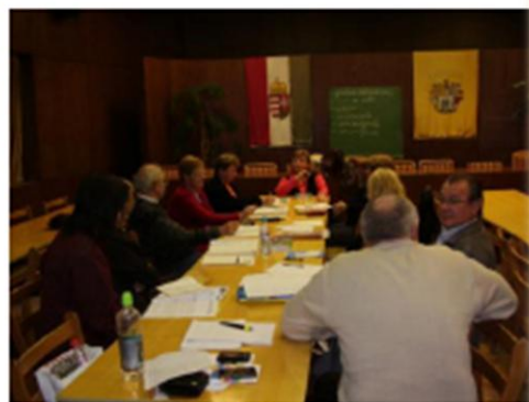
Horvát nyelvtanfolyam Teško je grijati stolicu i učiti hrvatski