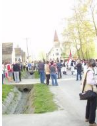
Drávasztára / Starin